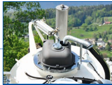
Umschaltkopf für schnelle Saug-/ Druckumschaltung