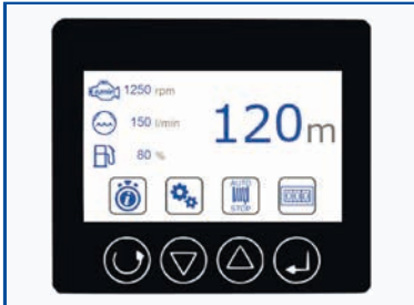
Intuitive Fahrzeugbedienung mit Multifunktions- display und optionaler Funkfernsteuerung