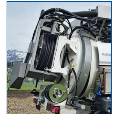
KAISER Spannringverschluss - bietet hohe Sicherheit durch gleichmässigen Schliessdruck und Schutz vor Schlamm- spritzern bei Tankdeckelöffnung