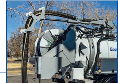
Teleskopierbarer Saugausleger KSR10 oder Saugausleger KSR71 für gemeinsame Positionierung des Saug- und Spülschlauchs