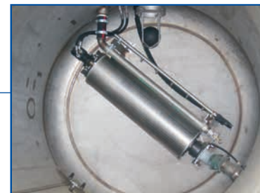
Tank aus Chromstahl mit ROTOMAX- Wasserrecycling-System