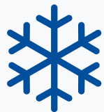
Wintersicher durch Wasserzirkulation oder zusätzliches Heizsystem