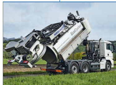
Schnelle und vollständige Tankentleerung durch Kippsystem und integrierten Reini- gungsdüsen